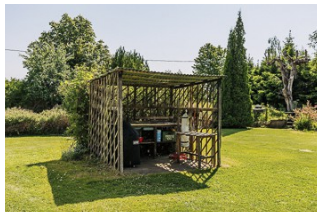
Unterstellplatz zum Grillen