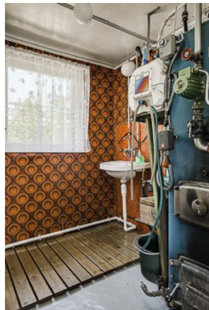
Heizungsraum und Badezimmer vom 1. Haus