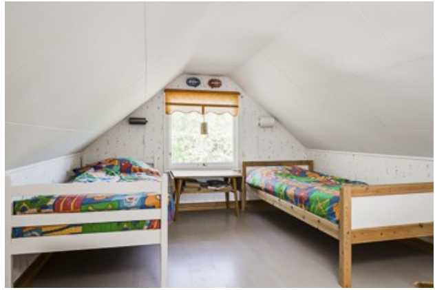
in der Schlafloft vom 2. Haus