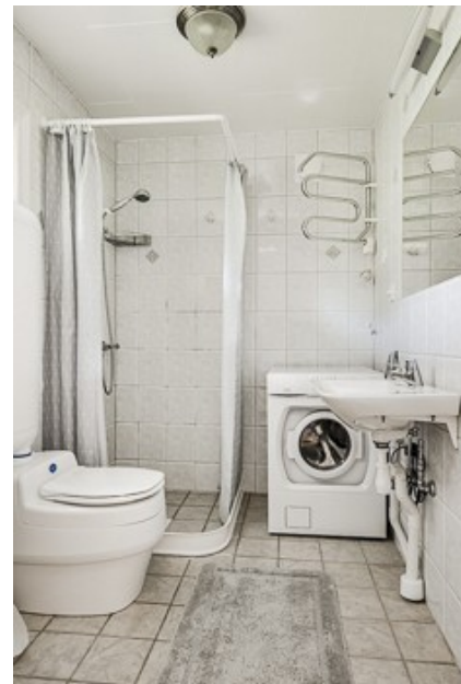
Badezimmer vom 2. Haus