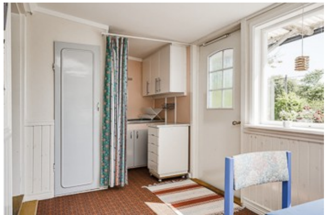
in der verglasten Veranda vom 1. Haus