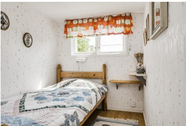
2. Schlafzimmer vom 1. Haus