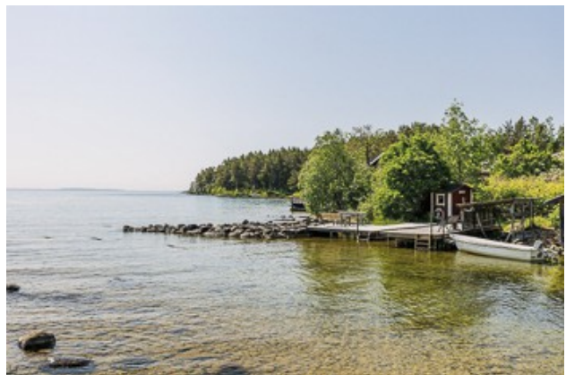
Bootsanleger am Vätternsee