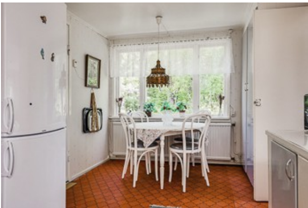
in der Küche vom 1. Haus