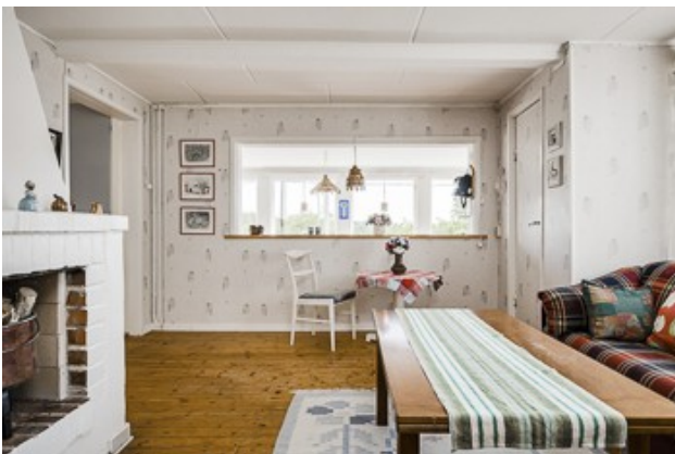
im Wohnzimmer vom 1. Haus