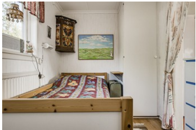
1. Schlafzimmer vom 1. Haus