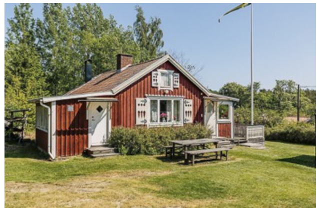
Blick auf das 1. Haus