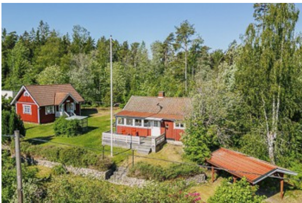
Blick auf die beiden Häuser