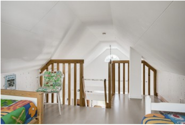
in der Schlafloft vom 2. Haus