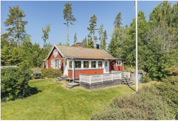
Blick auf das 1. Haus