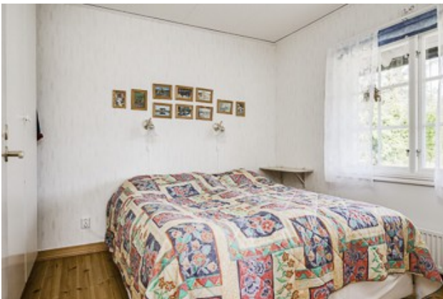
1. Schlafzimmer vom 2. Haus