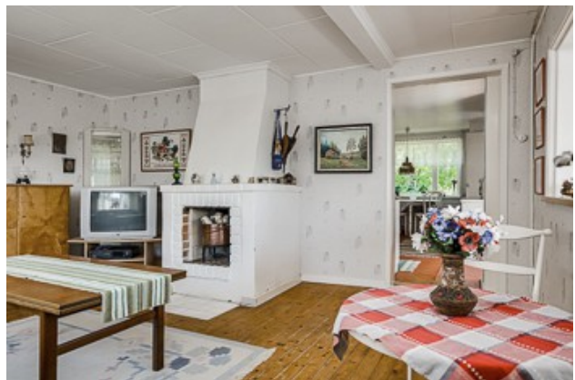
im Wohnzimmer vom 1. Haus