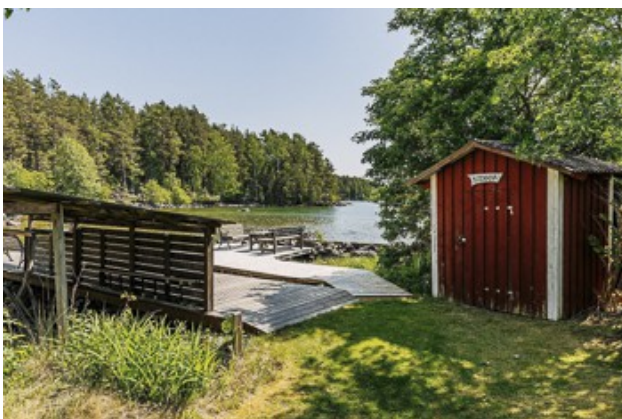
Bootsschuppen mit Bootsanleger