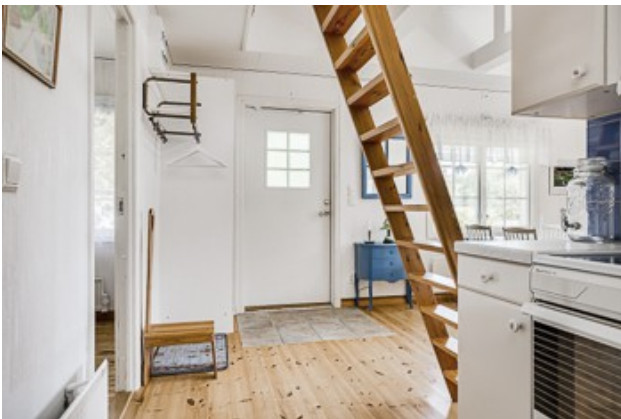
Wohnraum mit Treppe in die Schlafloft 2. Haus