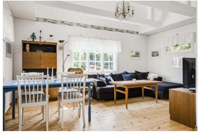
Wohnzimmer vom 2. Haus