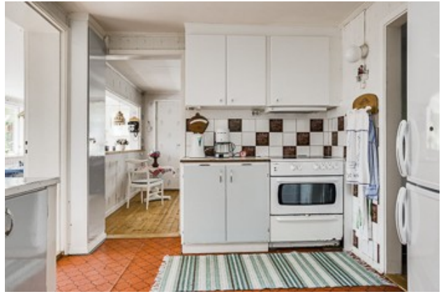
in der Küche vom 1. Haus