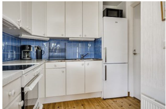
Küche vom 2. Haus