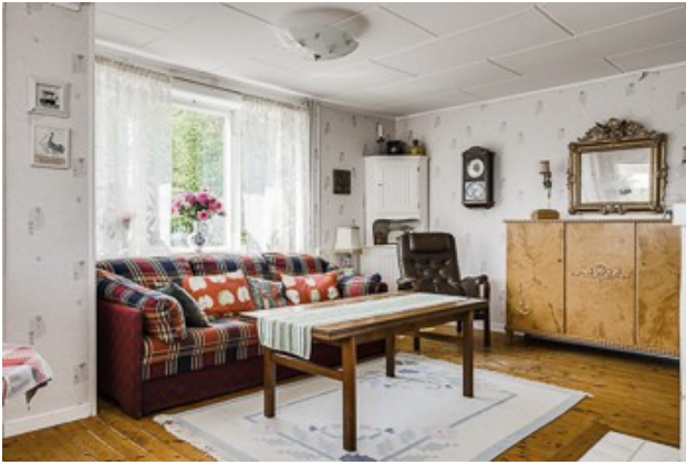
im Wohnzimmer vom 1. Haus