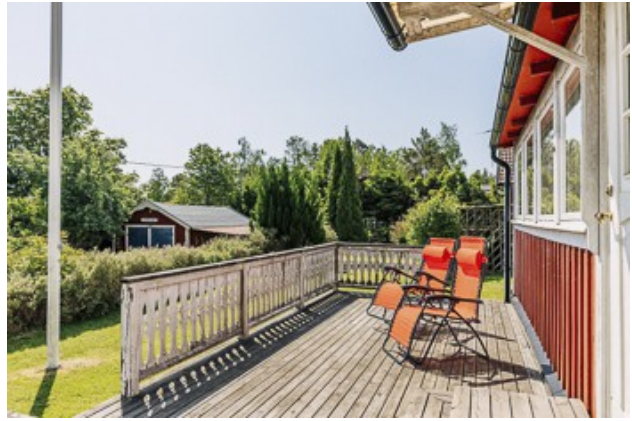
Veranda vom 1. Haus