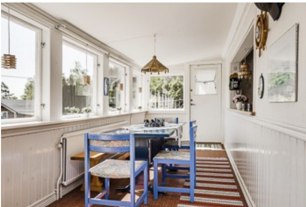
in der verglasten Veranda vom 1. Haus